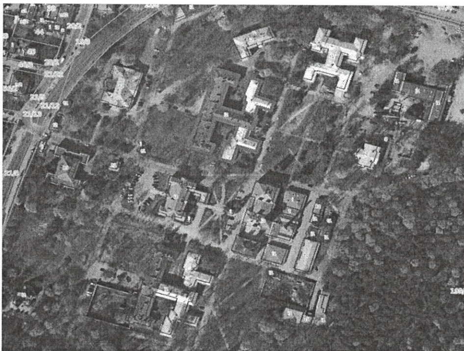
Rys. 1. Lokalizacja Pawilonu II we wschodniej części zespołu szpitalnego MSCZ

Przedsięwzięcie lokalizuje się na terenie Mazowieckiego Specjalistycznego Centrum Zdrowia im. prof. Jana Mazurkiewicza przy ul. Partyzantów 2/4 w Pruszkowie, stanowiącego dawny kompleks Szpitala Tworkowskiego (dalej: Szpital ) na fragmencie obszaru przeznaczanego w „Miejscowym Planie Zagospodarowania Przestrzennego Części Osiedla Malichy i Terenu Szpitala Tworkowskiego w Pruszkowie” (dalej: MPZP ) na Terenie Usług Zdrowia (IUZ) Pawilonu II na dz. 199/6 ob.25.