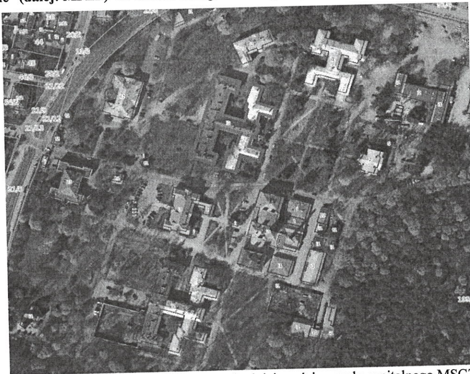
Rys. 1. Lokalizacja Pawilonu II we wschodniej części zespołu szpitalnego MSCZ

Przedsięwzięcie lokalizuje się na terenie Mazowieckiego Specjalistycznego Centrum Zdrowia im. prof. Jana Mazurkiewicza przy ul. Partyzantów 2/4 w Pruszkowie, stanowiącego dawny kompleks Szpitala Tworkowskiego ( dalej: Szpital ) na fragmencie obszaru przeznaczonych w „Miejscowym Planie Zagospodarowania Przestrzennego Części Osiedla Malichy i Terenu Szpitala Tworkowskiego w Pruszkowie” ( dalej: MPZP ) na Terenie Usług Zdrowia (1UZ) Pawilonu II na dz. 199/6 ob.25.